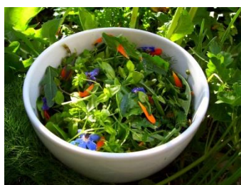
Salade de printemps

Les animations de l'été arrivent ! @OTAMP